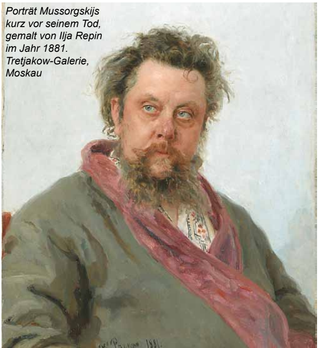
Porträt Mussorgskijs kurz vor seinem Tod, gemalt von Ilja Repin im Jahr 1881. Tretjakow-Galerie, Moskau